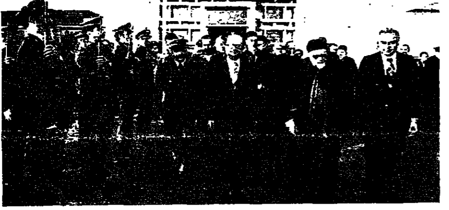
البطريك خريش في المطار ويستقبله الوزير روفائيل

أعلن بطريرك البطريرك الماروني مار انطونيوس بطرس خريش لدى عودته من روما امس، ان البابا يعمل لا يفتأ لبنيان لبنان والوطن التاجي والتعايش بين جميع طوائفنا. وقال خريش في بيان له: لقد كان لبنيان في صميم ما قمنا به من نشاطات واجريتها من محادثات سواء كان في باريس ام في روما. وقد اجتمعنا في باريس مع كبار المسؤولين وفي طليعتهم الرئيس جيمس كارول ديستان، وبعثنا بالبيعة على الصفحة ٤.